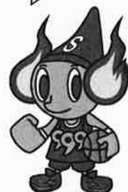
島根スサノオマジック マスコットキャラクターすさたまくん